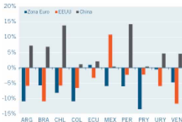
GRÁFICA 1. Variación en participaciones de mercados de exportaciones para países de LAC